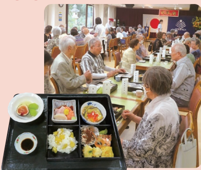
祝い膳 松花堂弁当