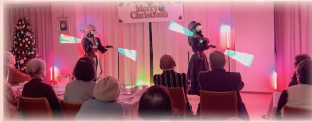
LEDライトにメッセージが映し出されました!! “メリークリスマス京都ヴィラ” “祝・開苑40周年”