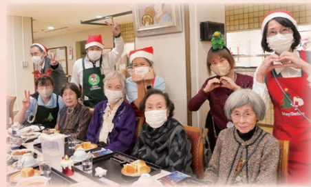
お料理もマジック&ジャグリングショーも大満足♡