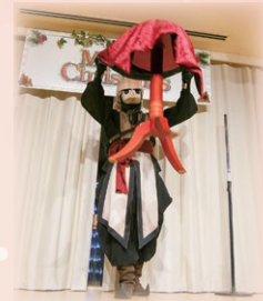
テーブルが宙に浮きました!!