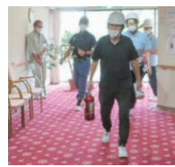
消防避難訓練の様子