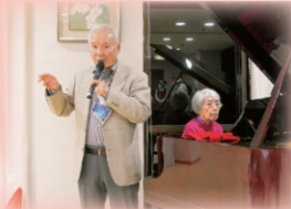
全員で「きよしこの夜」を斉唱