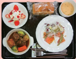
クリスマスディナー