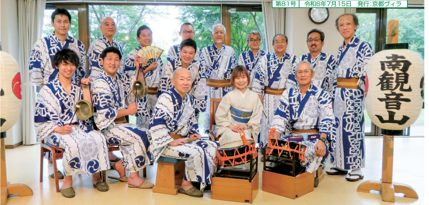
祇園祭「公益財団法人 南観音山保存会」囃子方会の皆様 (令和6年6月9日 京都ヴィラにて)