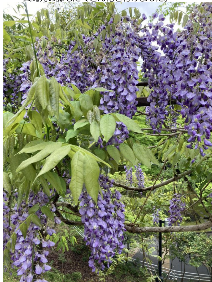
玄関先の藤もたくさん花を付けました。