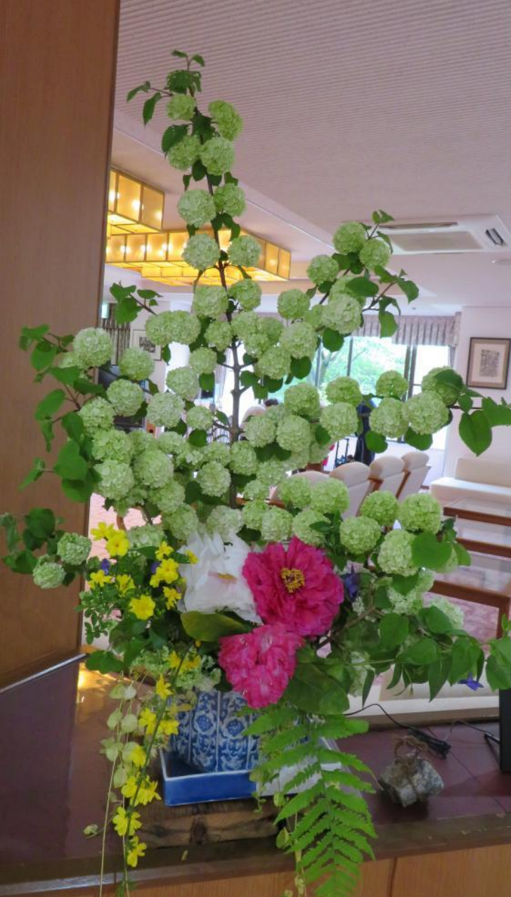
牡丹・おおでまり・シャクナゲ・オウバイモドキを アレンジしました。