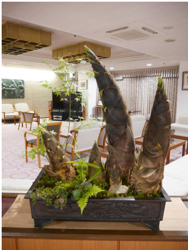
旬の筍をオブジェにしました。