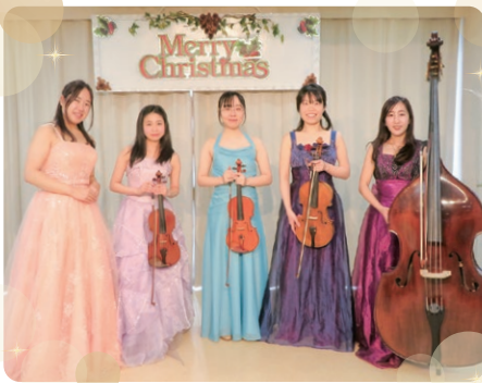
神戸楽友協会の皆様

今年のクリスマスは神戸楽友協会のメンバーによる弦楽五重奏コンサートを開催しました。低音のコントラバス、高音のヴァイオリン、すべての楽器が調和のとれたリズムでとても心地よく心に染み渡りました。